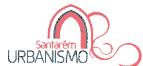
Ricardo Gonçalves Ribeiro Gonçalves